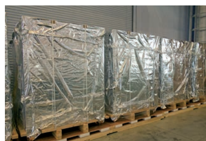
スキッドバリヤ梱包