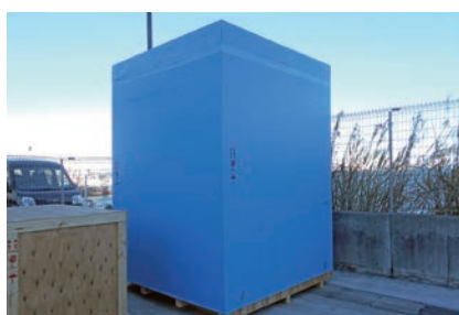
木箱ブルーシート梱包