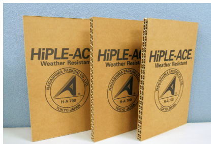
2層強化ダンボール AA700G