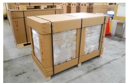
柵付上下キャップ