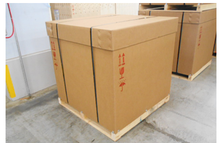
上キャップ+スリーブ+木製パレット