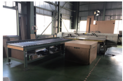
アップダウンスロッター