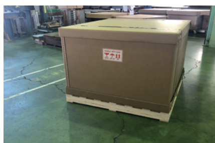
上下キャップ+スリーブ+木製パレット