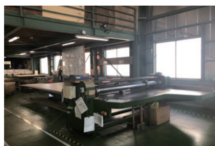
ロータリースリッター