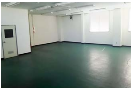
貨物一時保管場所 (4F)