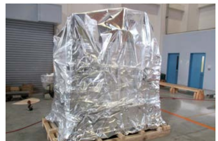
スキッドバリヤ梱包