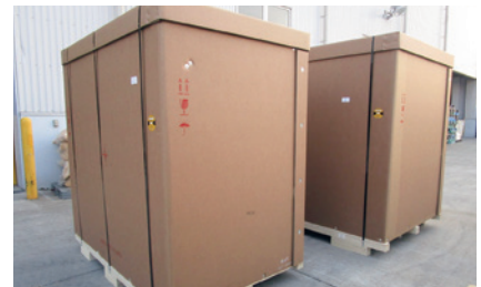
強化ダンボール梱包