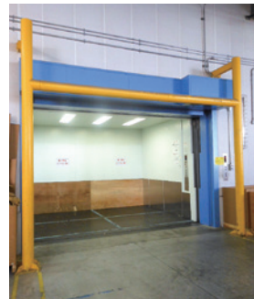
貨物用エレベーター (3.5ton)